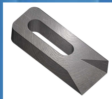
Lame de rechange : Réf : LDC/7.5